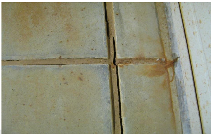
Foto: Beschadigde kitvoeg.

Een voegvullingsmassa of een afdichtingsprofiel kan gescheurd en/of beschadigd zijn. De DI merkt dit aan als een onvolkomenheid, tenzij de scheur of beschadiging over de volledige hoogte van de vulling of afdichting aanwezig is. Een scheur of beschadiging over de volledige hoogte van de vulling of afdichting is een gebrek.