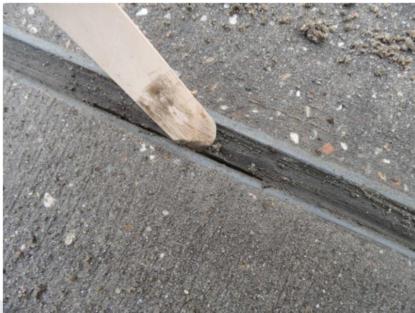
Foto: Afdichting is onthecht.