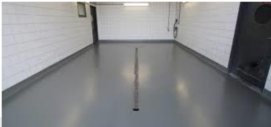
Foto: Voorbeeld kunstharsgebonden voorziening.