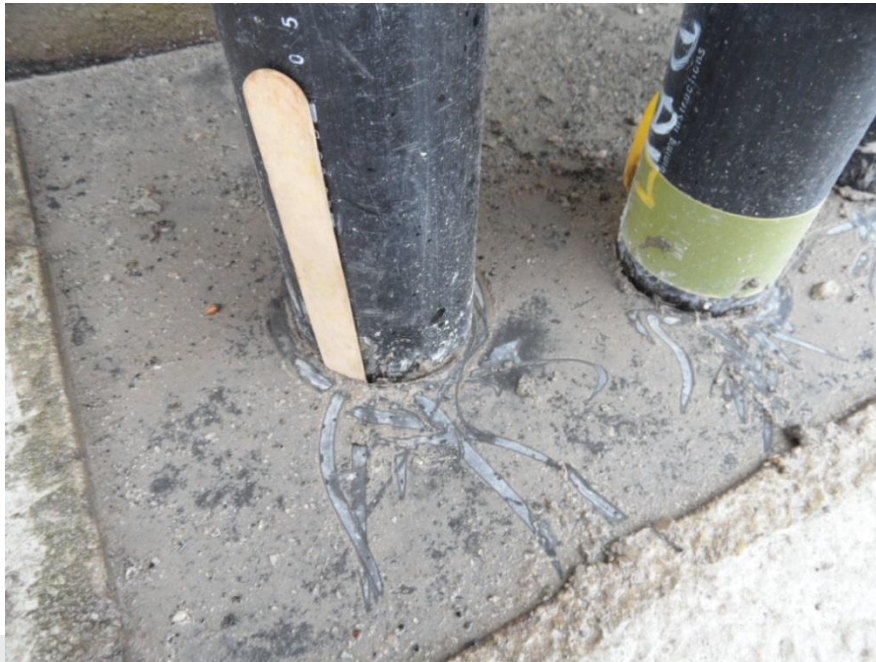
Foto: Voorbeeld van een niet-afgedichte doorvoer.

Bij doorvoeren in de voorziening beoordeelt de DI visueel of vloeistoffen langs of door de doorvoeren – eventueel voorzien van een afdichting met voegvullingsmassa of een pakking – de niet-belaste zijde bereiken of kunnen bereiken.