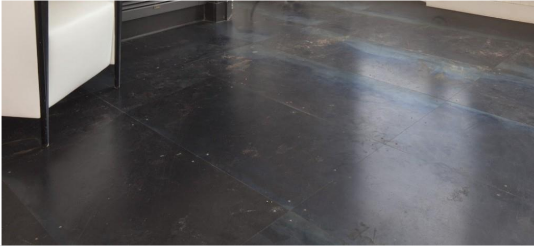
Foto: Voorziening van aan elkaar gelaste metaalplaten.