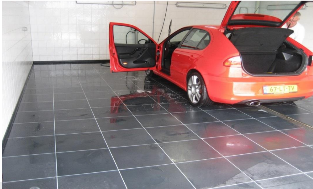
Foto: Vloer uitgevoerd met kunststof elementen.