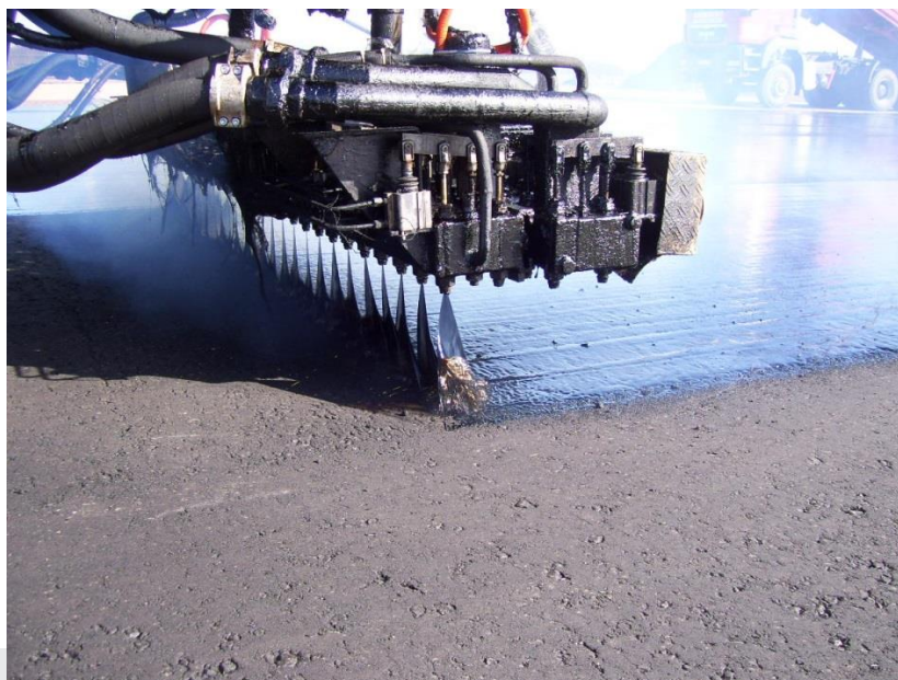
Foto: Aanleg vloeistofdichte asphaltconstructie.