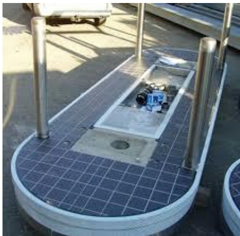
Foto: Pompeiland voorzien van tegels.