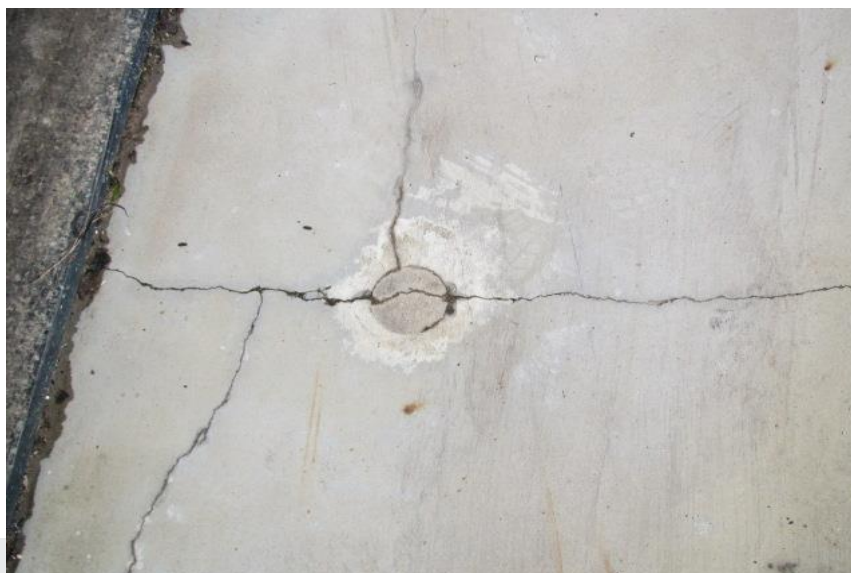
Foto: Voorbeeld van scheur.

De DI beschrijft scheuren en/of breuken en/of legt deze vast op een inspectietekening.