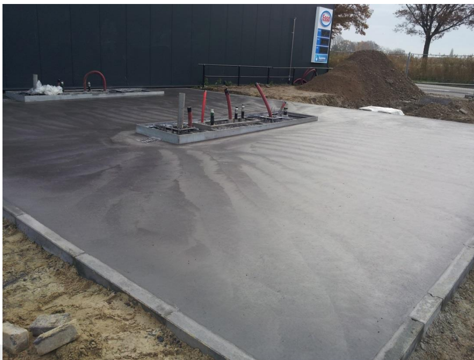
Foto: Aanleg van vloeistofdichte betonvloer.